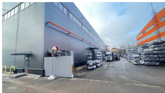
Вход на КПП для оформления пропуска